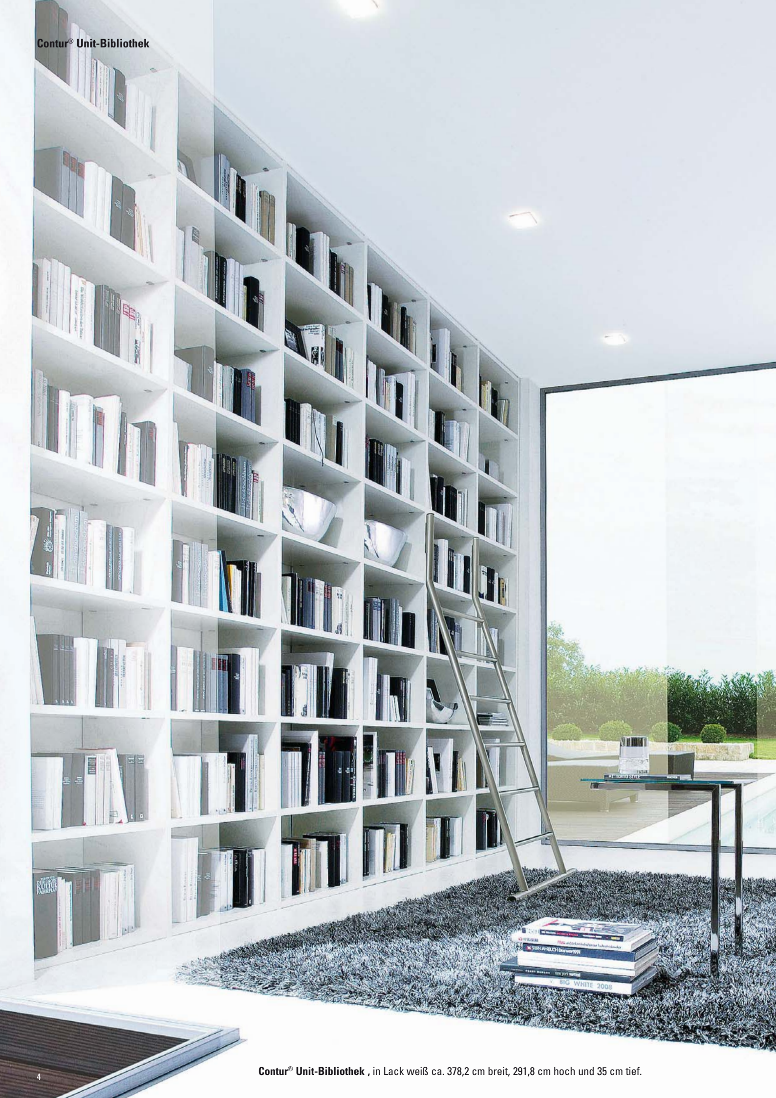
Contur® Unit-Bibliothek , in Lack weiß ca. 378,2 cm breit, 291,8 cm hoch und 35 cm tief.